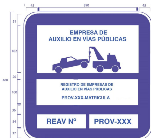
Placa de vehículo de servicio de auxilio en vías públicas

a) Una placa en el vehículo de auxilio ubicada en la parte frontal o posterior del mismo, según la configuración del vehículo. Será de material plástico o metálico de alta resistencia según el diseño y características que se indican a continuación: