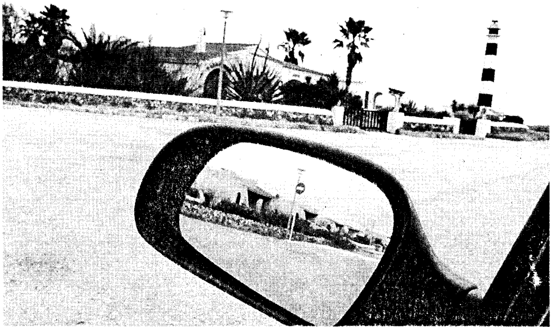
CALA EN BOSC. Es la urbanización que tiene más problemas con la calidad de su agua, y a la que podría llegar primero el caudal de la desaladora

Comente esta noticia en nuestro diario digital. www.menorca.info