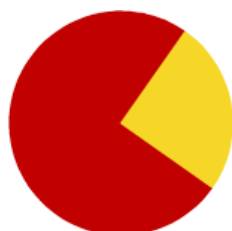
Viviendas Turísticas Vacacionales