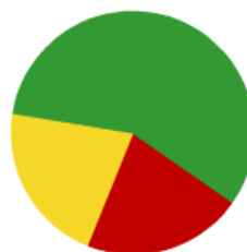
Alquiler de Vehículos