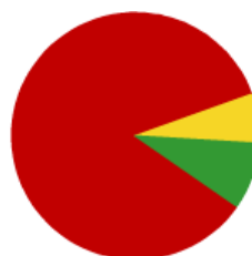
Cafeterías, bares y restaurantes