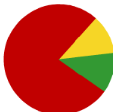
Total de todos los sectores

¿Cómo ha evolucionado su facturación del mes de junio con respecto al mismo mes del año pasado?