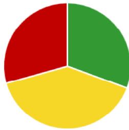
Total de Todos los sectores