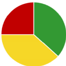
Cafeterías, bares y restaurantes